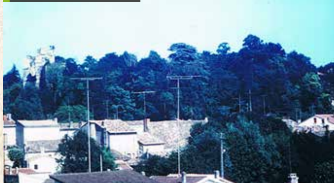
Une colline boisée en lieu et place du château en 1996.

Les travaux de dégagement de la végétation menés de 1983 à 1986 par l'ASPHM puis à partir de février 1996 par l'ASVPM, permettent