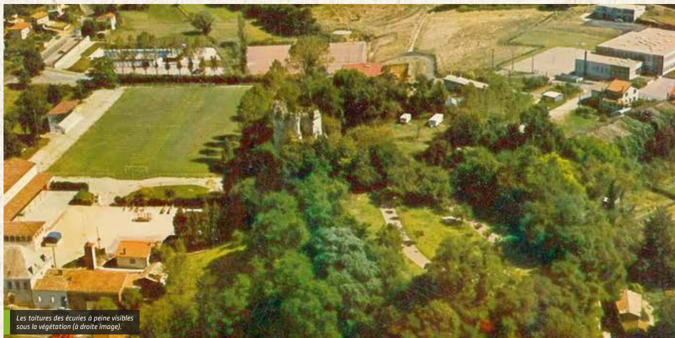
Les toitures des écuries à peine visibles sous la végétation (à droite image).