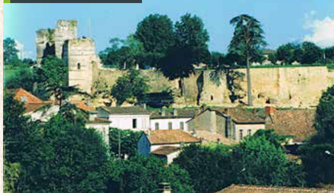
Les remparts restaurés en 1998 par l'ASPHM.

Constitué de pans coupés qui s'étendent sur un peu plus de 200 mètres, le rempart représente un chantier colossal. Au début de l'année 1996, des personnes en insertion par le biais des Brigades Vertes participent au dégagement de ce qui reste du lierre et des arbustes le long des remparts. En août de la même année, un chantier international de jeunes financé par la Communauté de Communes de Haute-Saintonge fait de même.