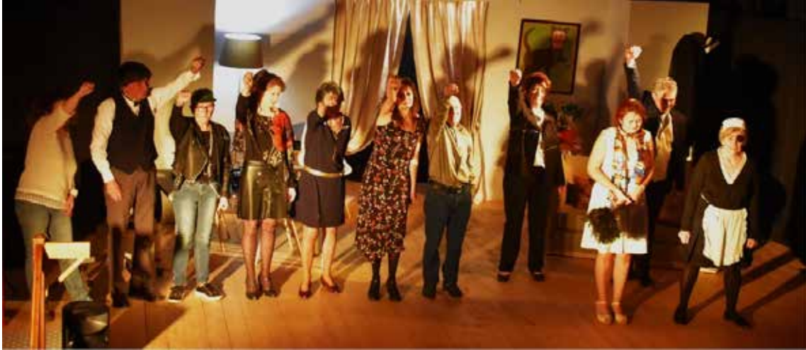
La troupe « les Comédiens en Balade » a terminé la saison théâtrale en remportant un vif succès auprès d'un public très nombreux venu l'applaudir.